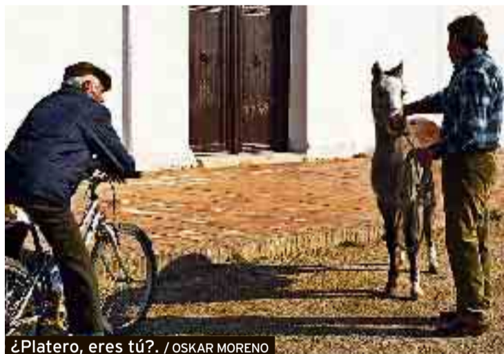
¿Platero, eres tú?. / OSKAR MORENO