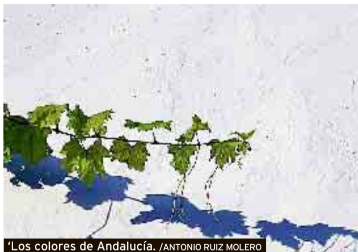
'Los colores de Andalucía'. / ANTONIO RUIZ MOLERO