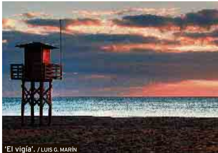
'El vigía'. / LUIS G. MARÍN