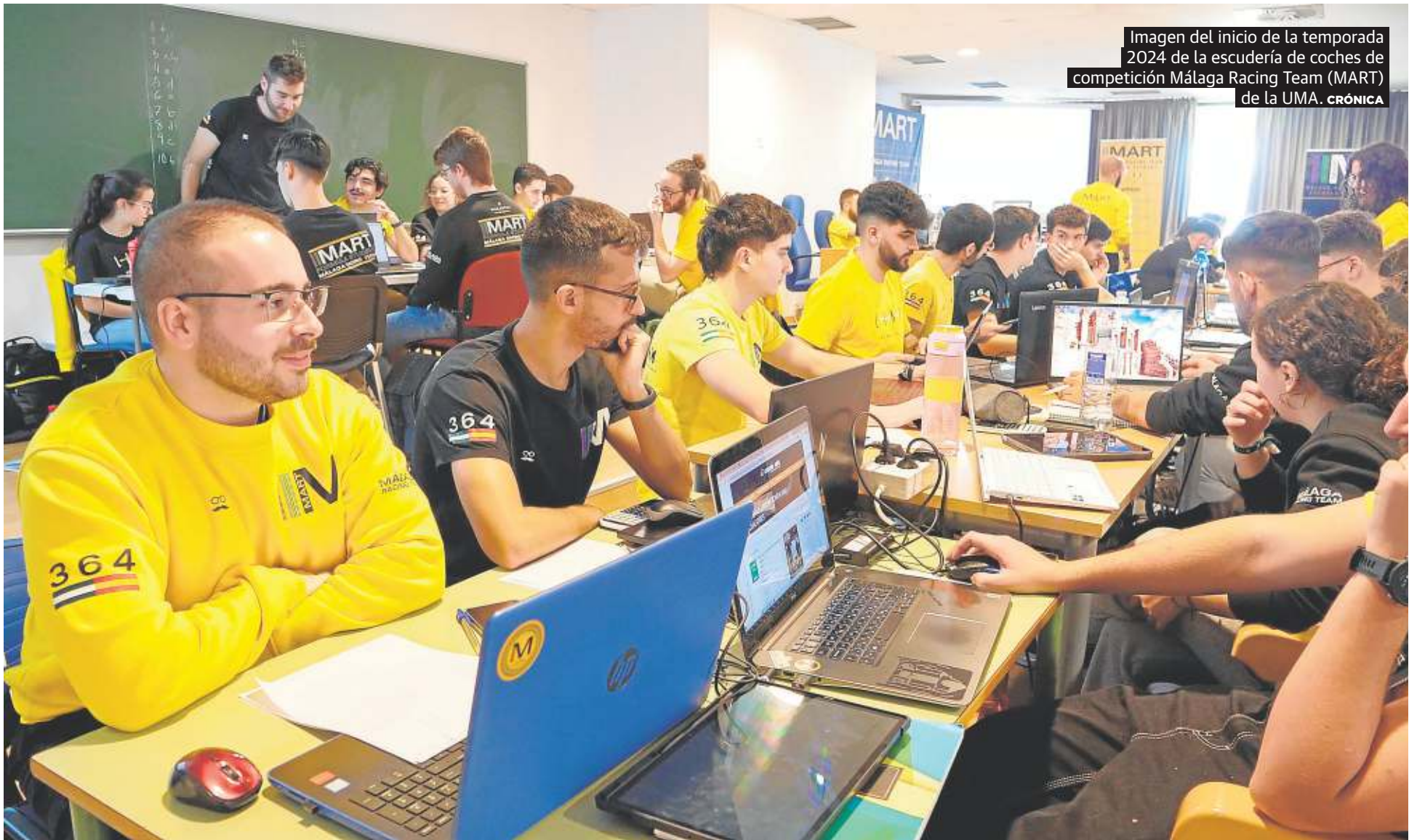
Imagen del inicio de la temporada 2024 de la escudería de coches de competición Málaga Racing Team (MART) de la UMA. CRÓNICA