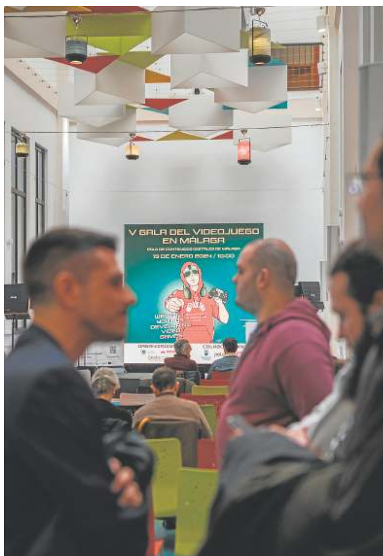
Todos expectantes ante el inicio de la V Gala del Videojuego. CRÓNICA

tel que necesitaban, pusieron el punto y final a más de un año de trabajo y aprendizaje y, como menciona Fernández, «fue algo muy emotivo». Empezaron en octubre de 2023 con el máster, primero trataron la materia de forma teórica, para así tener todos los conocimientos necesarios para aplicarlos de forma práctica, y el pasado 19 de enero lanzaron los birretes al cielo para oficializar el final de su camino de aprendizaje.