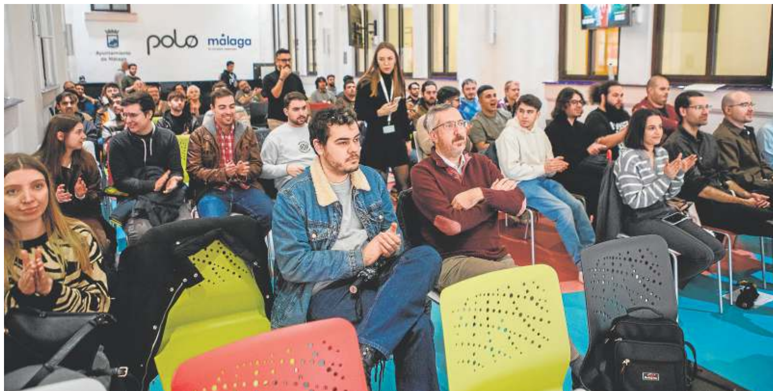
El público aplaude ante la exposición de los trabajos finales. CRÓNICA

Mostraron cada uno de los detalles de su proyecto y celebraron el final de un largo camino. Para ellos fue la guinda del pas-