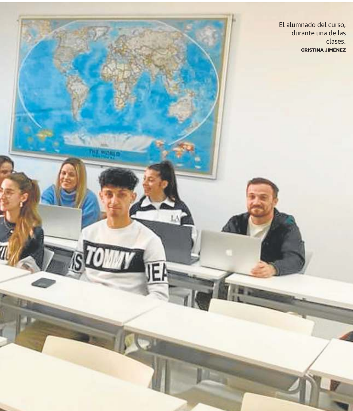
El alumnado del curso, durante una de las clases. CRISTINA JIMÉNEZ