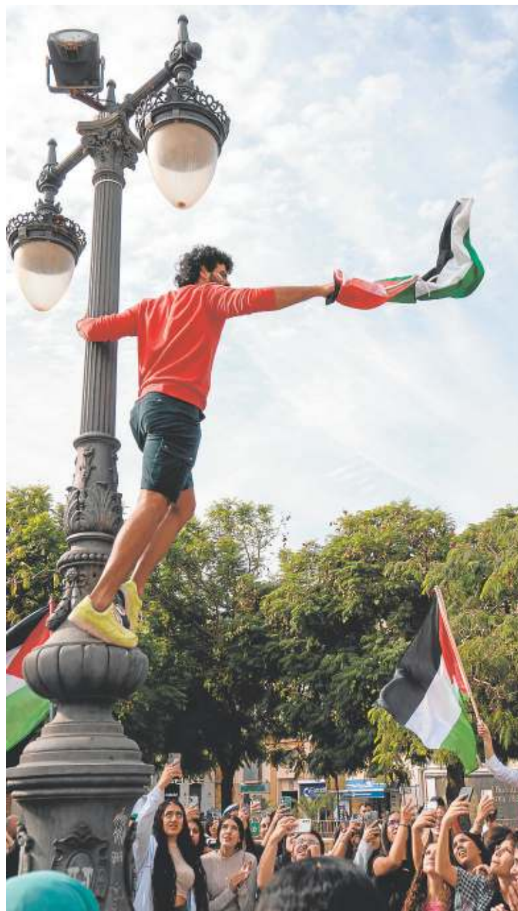
Manifestación en Málaga por la liberación de Palestina. JERÓNIMO LEAL

no pudieron prestarnos mucha atención», aun así, sacaron el tiempo suficiente para dotarlos de contactos con los que pudieron ir moviéndose por el territorio.