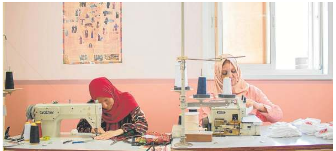
Dos mujeres palestinas cosen en Belén. JUDITH CASTAÑEDA

La Asociación Centro de Información Alternativa (AIC) es una agencia de noticias de Palestina que se sostiene mediante donativos y ayuda internacional. «Trabajan cuatro personas y es muy difícil que sea rentable por lo que