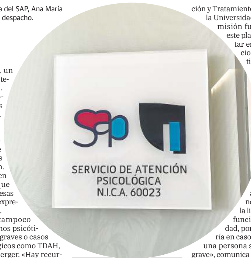
Cartel del despacho del Servicio de Atención Psicológica

De hecho, afirma que siempre que ven a una persona, evalúan y ven que tiene un trastorno de la conducta alimentaria, es derivada porque requiere un tratamiento de la conducta alimentaria, es decir, una terapia individual, un