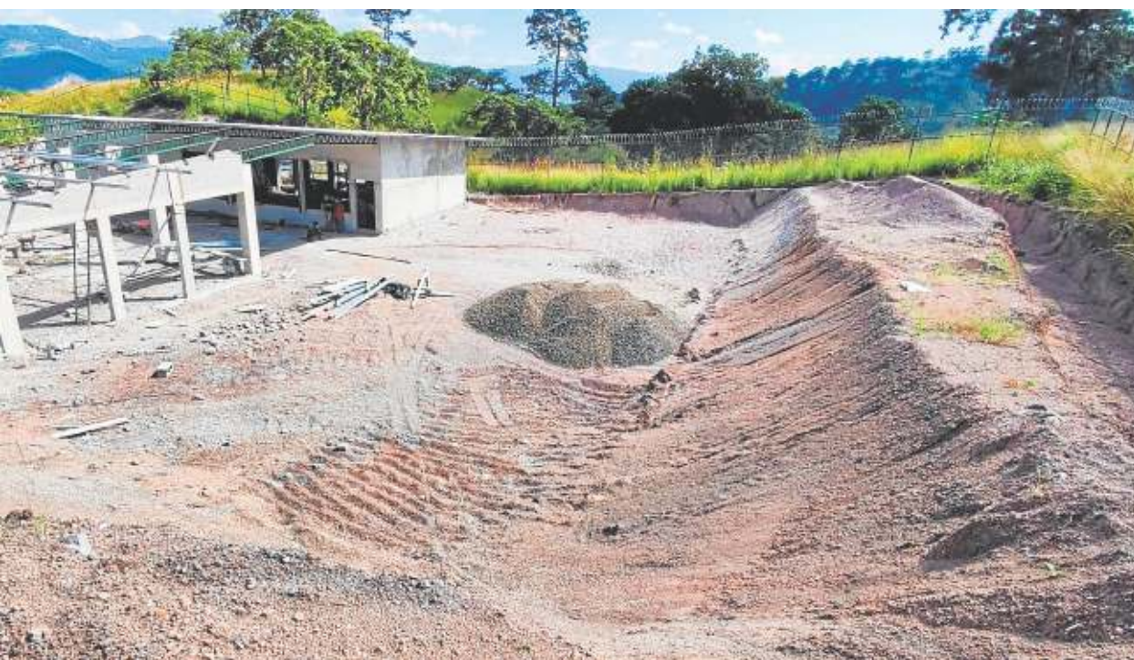
El vertedero de Tegucigalpa es de las zonas más pobres de Honduras. CRÓNICA

ria, la fundación ha abierto en su página web una sección denominada 'Plántate por Honduras', en ella se puede ver más información sobre el proyecto. Pulsando el botón «colaborar», rellenando unos cuantos datos personales y seleccionando la cantidad que cada persona quiera aportar, uno podrá ser partícipe de esta iniciativa.