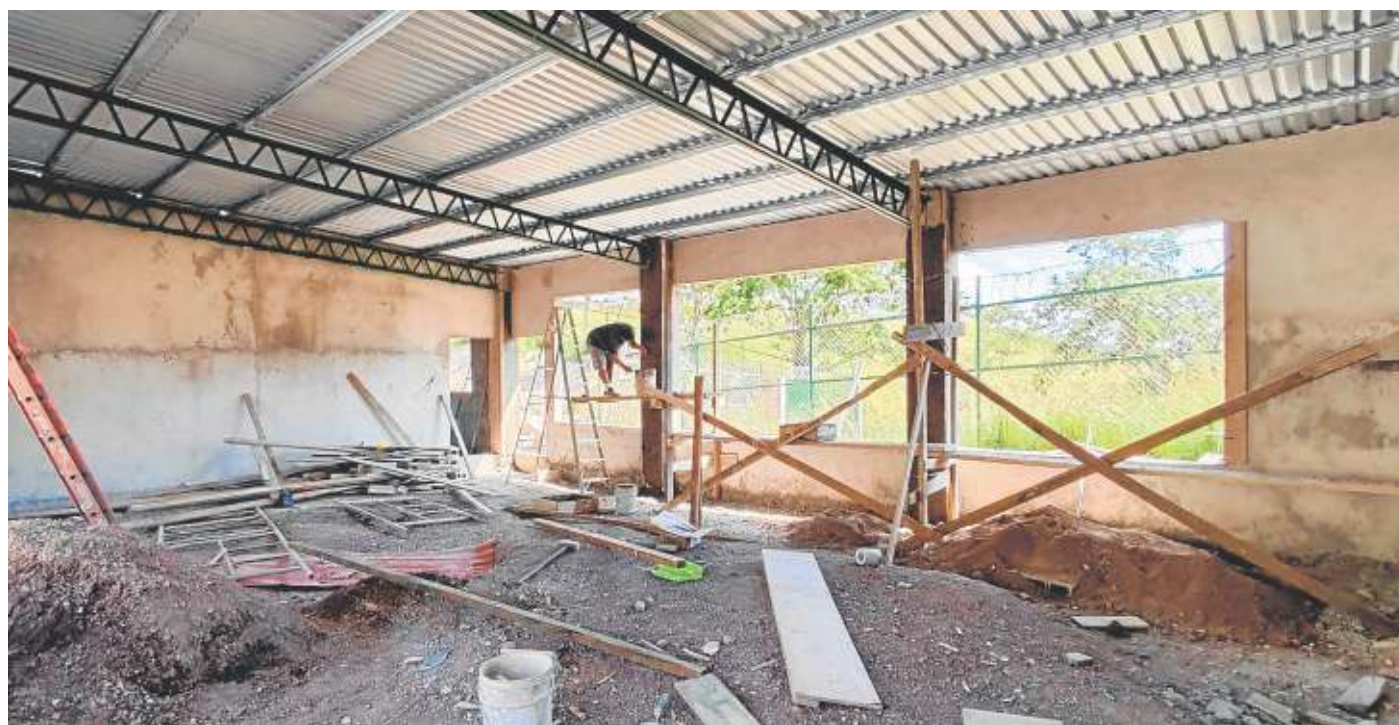
ACOES y FGUMA se unen para ayudar a más de 400 niños con la creación de estructuras sanitarias y educativas. CRÓNICA