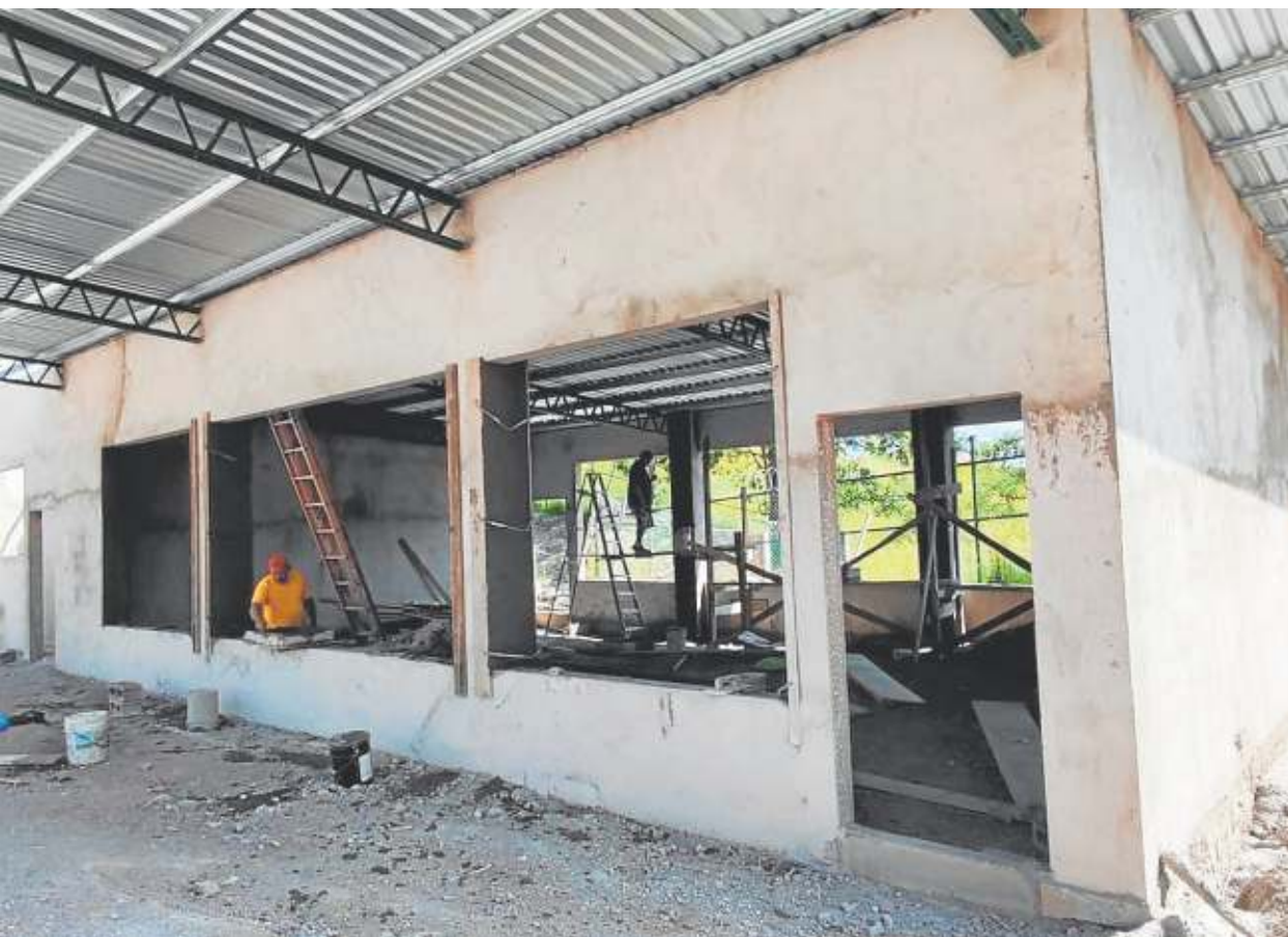
Las obras se suceden en el vertedero de Tegucigalpa. CRÓNICA