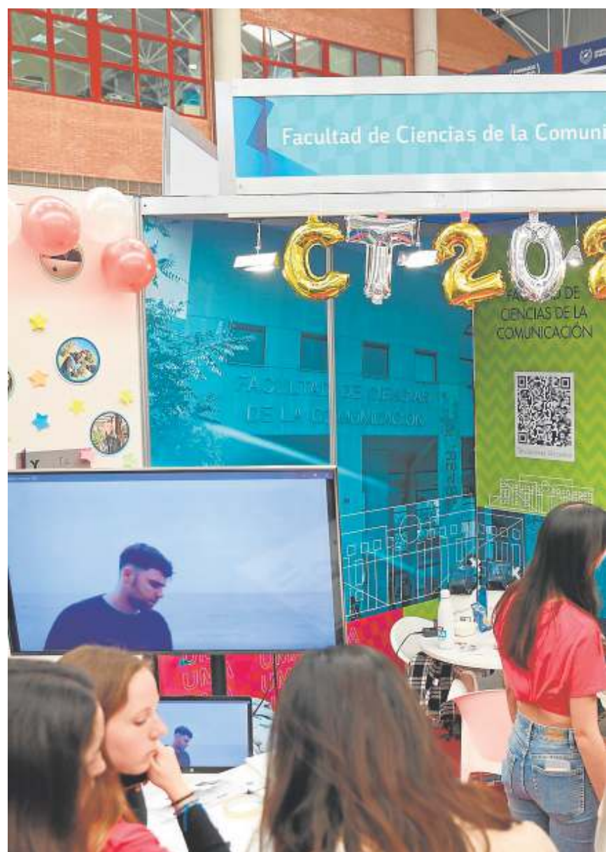
Jóvenes se concentran para participar en un estand.

bre las notas de ponderación y las clases para poder explicarles». El año pasado fue una de las preuniversitarias que estuvo en las jornadas para pedir consejo, pasó por el estand y una chica le explicó cosas de la carrera y, como recordó Rusu, «me ayudaron un montón». En el espacio dedicado a 'Barbie' conta-