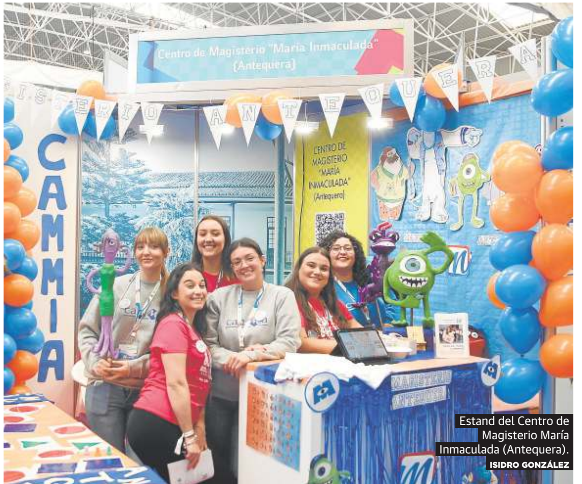
Estand del Centro de Magisterio María Inmaculada (Antequera).