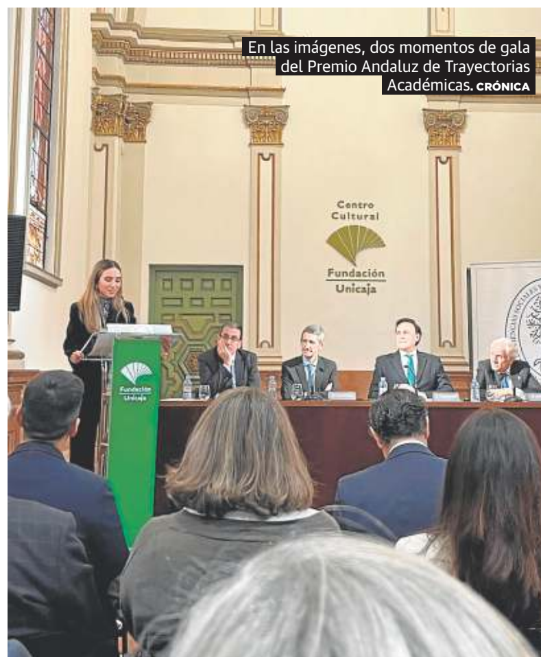
En las imágenes, dos momentos de gala del Premio Andaluz de Trayectorias Académicas. CRÓNICA