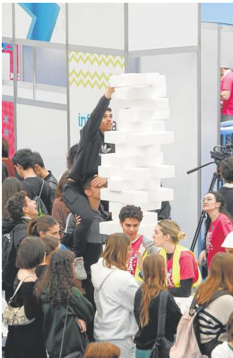
Un preuniversitario, en un juego sobre arquitectura.