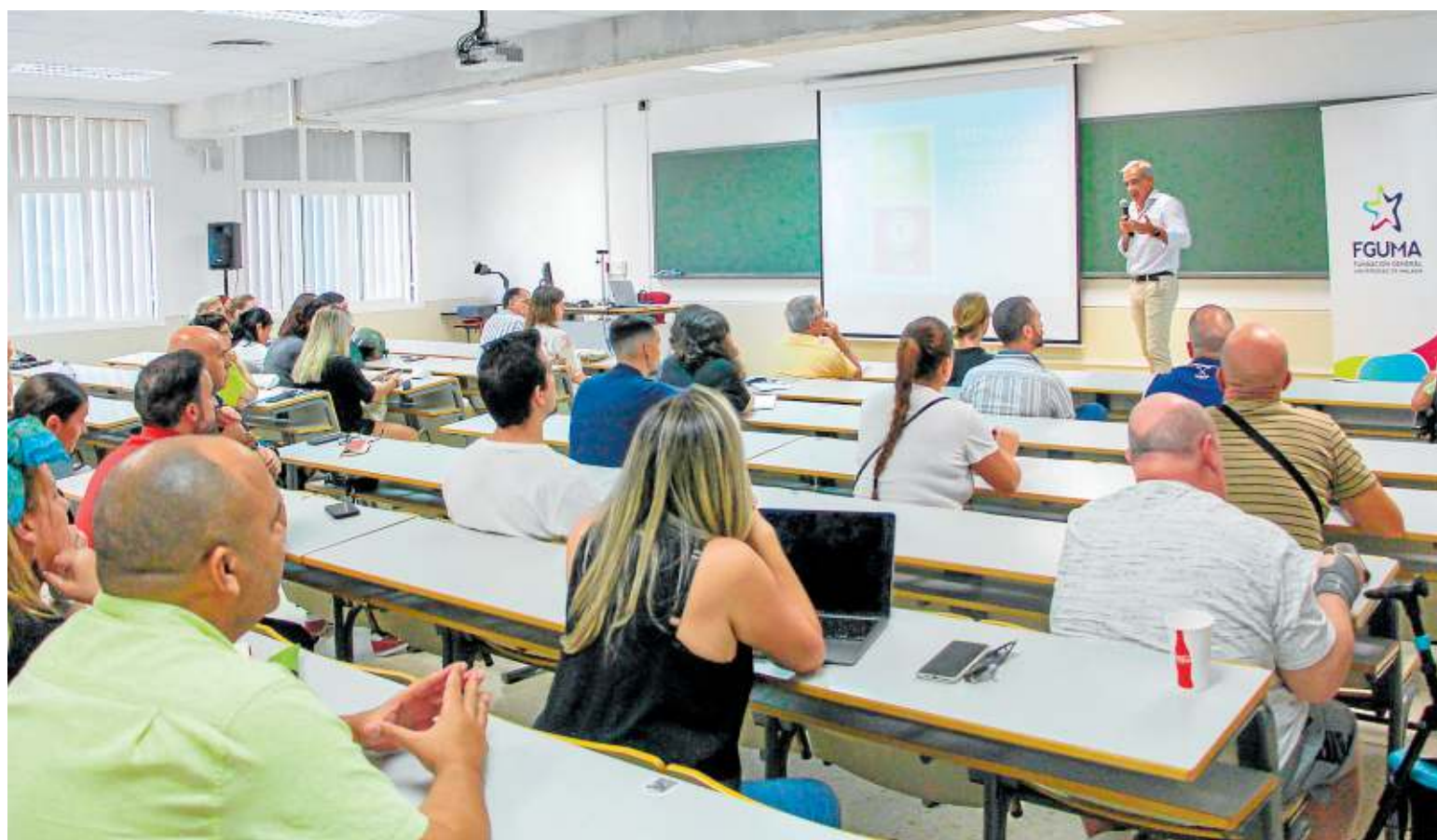
Día de la presentación del curso 2023-2024 de forma presencial en la Fundación General de la Universidad de Málaga. CRÓNICA

El plazo de matriculación de este curso ya está cerrado, pero la intención es que se sigan desempeñando a lo largo del tiempo. «Dependiendo del periodo de matriculación tiene un precio u otro. Mientras antes se haga, tie-