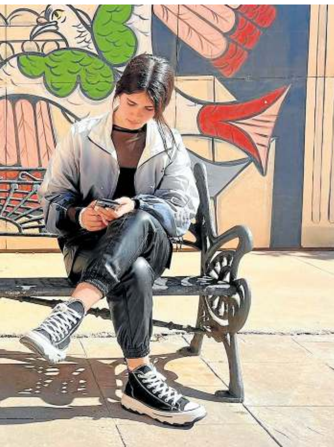
Estudios Ingleses, en el banco enfrente de su facultad. CRÓNICA