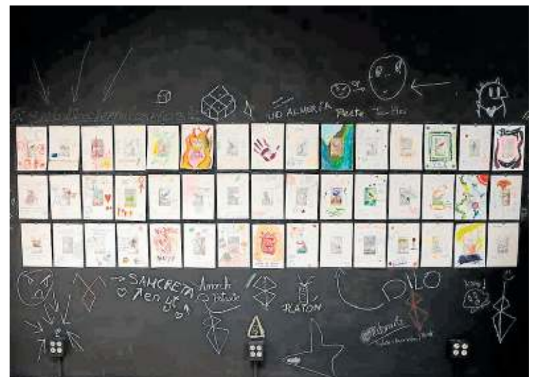
Pinturas realizadas por el público que asistió a la inauguración. I. GONZÁLEZ

La exposición se encuentra abierta hasta el día 15 de abril en la Galería Central de la Facultad de Ciencias de la Comunicación. En ella, podrás observar cada uno de los cuadros realizados por los alumnos y, además, tienes la oportunidad de participar pintando tu propia obra de arte para cooperar con el mensaje que esta obra quiere transmitir.