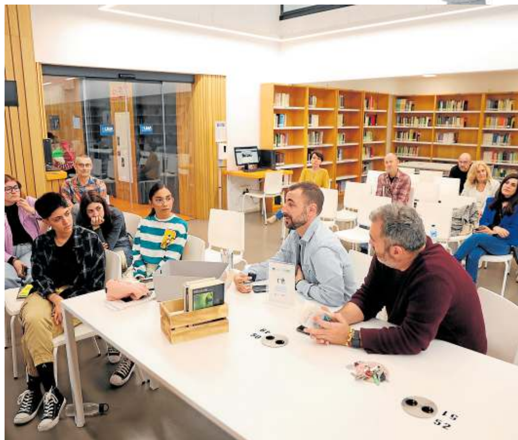
Charla entre amantes de la lectura en la biblioteca de la Facultad de Educación. ISIDRO GONZÁLEZ

gente no muestra ningún tipo de interés por la lectura.