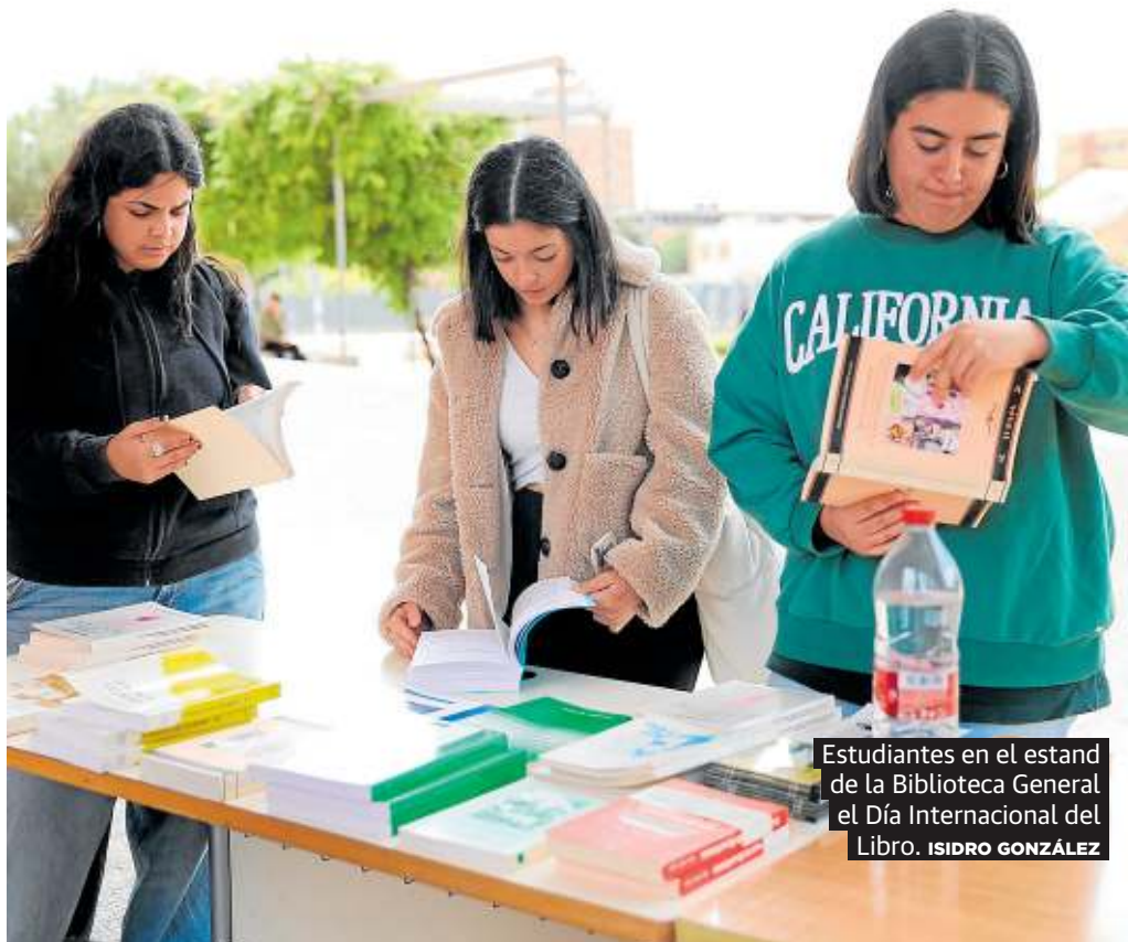
Estudiantes en el stand de la Biblioteca General el Día Internacional del Libro.

Desde pequeños, los colegios han realizado actividades relacionadas con este famoso día, aunque se organizaban de manera diferente. Si eras de los mayores, te tocaba leer, si eras de los más pequeños, elaborabas un marcapáginas para regalárselo a tu lector. Actualmente, esta dinámica se sigue efectuando en los colegios, pero cuando uno se hace mayor deja la tradición a un lado, y más, cuando la generación vi-