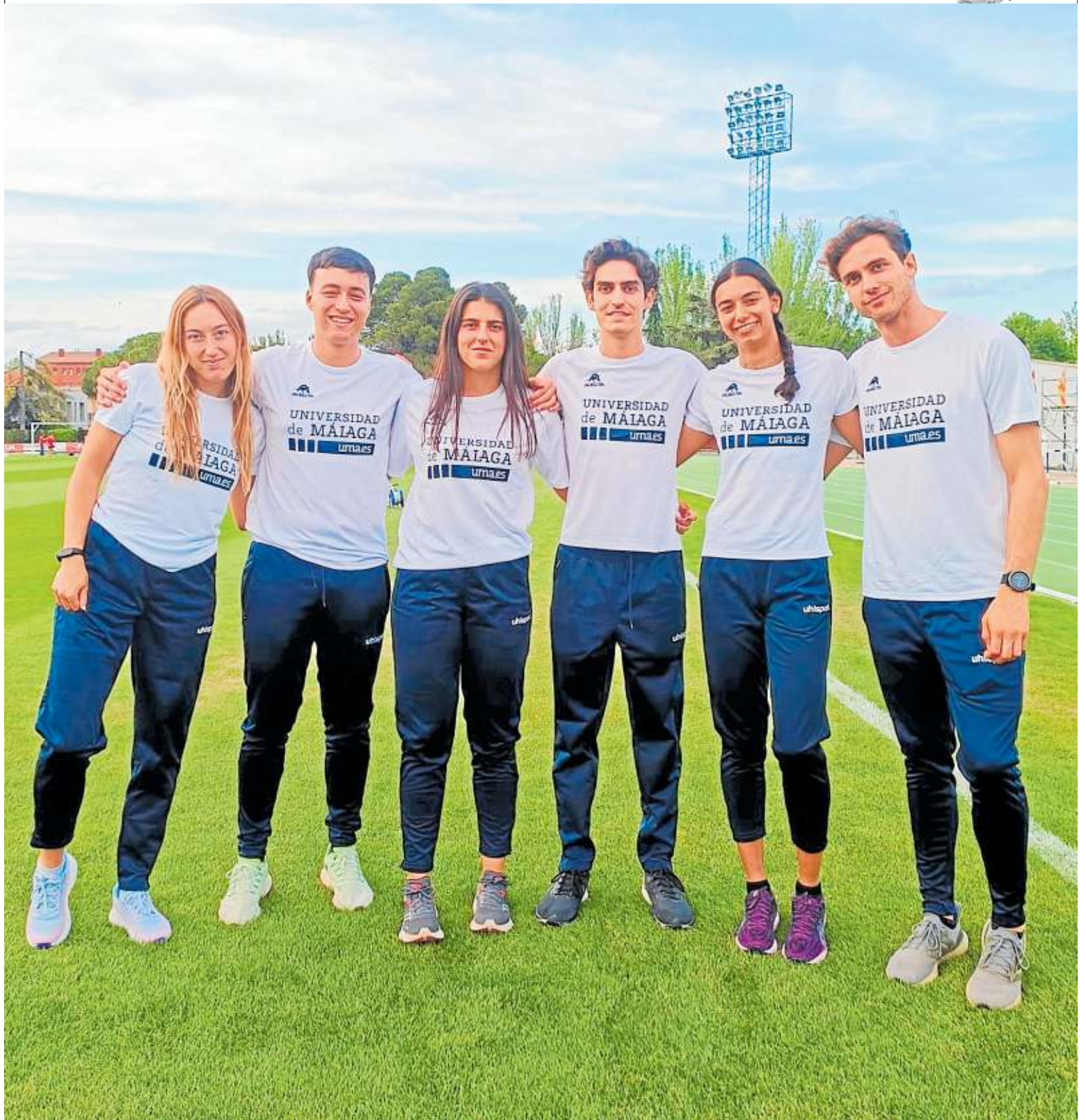
Los seis atletas representantes de la Universidad de Málaga en el campeonato celebrado en Ciudad Real. CRÓNICA

En el caso del campeonato universitario hubo varias disciplinas que contaron con semifinales, ya que «en las carreras en las que suele haber más gente hay que hacer una semifinal para llegar después hasta la final», cuenta Carmona. Lanzamiento de jabalina, 400 m vallas, salto de altura, 110 m.v y 10 km marcha fueron las disciplinas que contaron con la representación de universitarios malagueños. Tal y como aclara Carmona solo fueron seis representantes porque «ha coincidido con un Campeonato de Andalucía y algunos es-